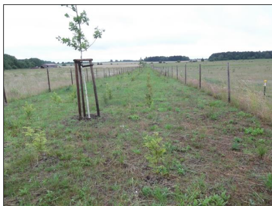
Bild rechts: Verkauf der ca. 650 langen Hecke des dritten Bauabschnittes