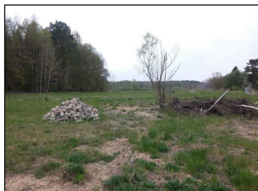
Abb. 3: Feldstein-/Holzhaufen am 12.10.16

Weiterführende Informationen können Sie bei Bedarf unter unten angegebener Adresse erhalten.