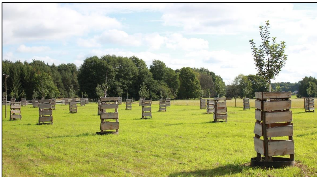
Streuobstwiese I. BA September 2015

Im Winter 2015/2016 wurde der II. Bauabschnitt mit ca. 200 Hochstämmen realisiert. Im Winter 2016/2017 erfolgte eine weitere Heckenpflanzung von ca. 8.500m 2 . Derzeit läuft die Entwicklungspflege.