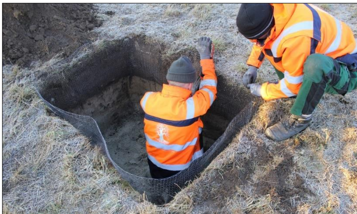
Verankerung des Schutzkorbes gegen Wühlmäuse

Die Streuobstwiese sowie die Hecke wurden auf einem privaten Acker im Herbst/Winter 2014/15 gepflanzt und über einen Grundbucheintrag dauerhaft gesichert. Die hier neu angelegten Streuobstwiesen erfüllen damit auch eine Pufferfunktion zur Ortslage. Es kamen vorwiegend alte und regional verwendete Apfel-, Birnen- und Pflaumensorten zum Einsatz. Diese wurden aus einer Nauener Baumschule bezogen, sodass sie auch an den mageren Standort angepasst sind. Die Grünlandpflege soll später durch Schafe oder Pferde erfolgen. Als eine besondere Herausforderung galt der Schutz vor Wühlmäusen, so dass mit Drahtkörben im Wurzelbereich gearbeitet worden ist.