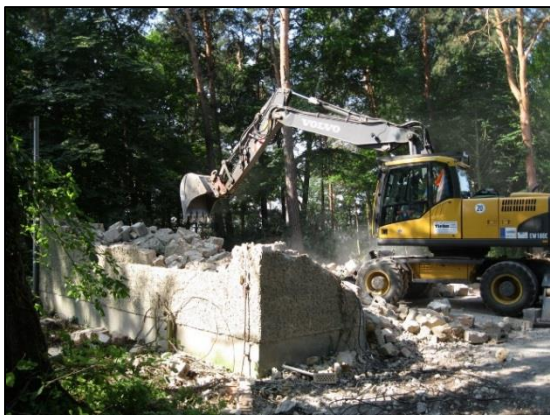
2 Abriss und Entsiegelung im Maßnahmenbereich Weinberg Gräbendorf