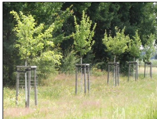
1 Streuobstbestände im Maßnahmenbereich Klein Eichholz; Stand Sommer 2013