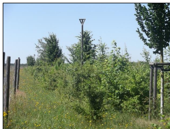
4 Feldhecke Klein Eichholz im Sommer 2014

Weiterführende Informationen können Sie bei Bedarf unter unten angegebener Adresse erhalten.