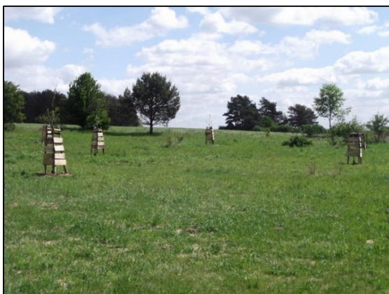
3 Alte Obstbaumsorten, Pflanzung 2015