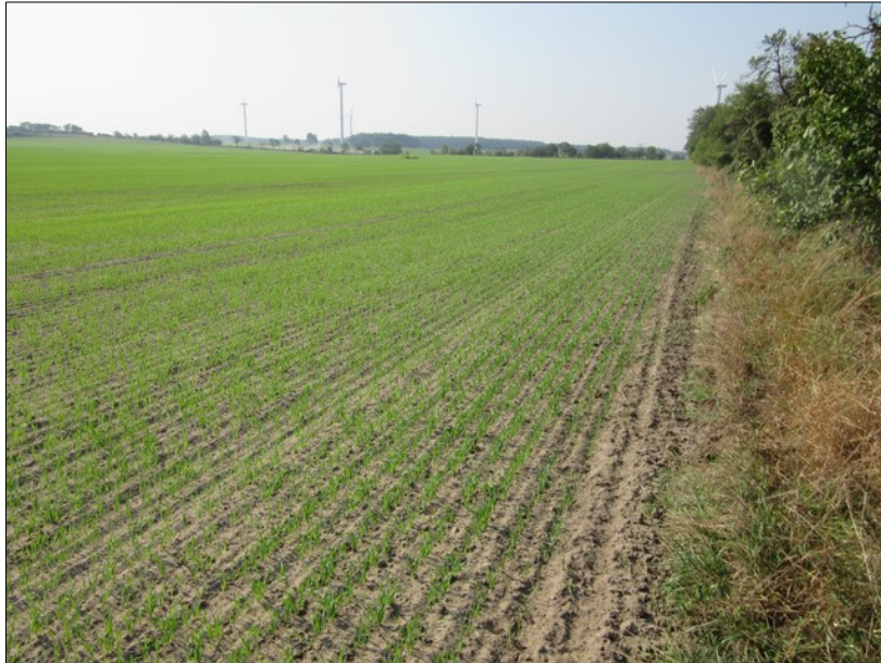
Abb. 1: Maßnahmenfläche 1 am Ortsrand Glienicke, Zustand vor Maßnahmenbeginn

In der Feldflur westlich von Glienicke ergab sich durch diesen Flächenerwerb die Möglichkeit, zwischen intensiv genutzten Landwirtschaftsflächen zwei große Grünlandbereiche zu etablieren. Damit soll neben den allgemein positiven naturschutzfachlichen Wirkungen dieses Maßnahmentyps speziell auch eine Habitatverbesserung für Feldlerchen erreicht werden. Diese finden in früh und dicht wachsenden Kulturen zu wenige oder keine geeigneten Brutflächen.