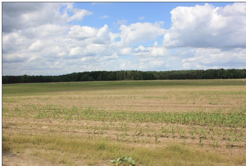
Abb. 2: Maßnahmenfläche 2, Zustand vor Maßnahmenbeginn

Für den Pool wurde eine Planung zur Erhebung des Ausgangszustandes und Entwicklung von Maßnahmenvorschlägen beauftragt und mit der Unteren Naturschutzbehörde abgestimmt.