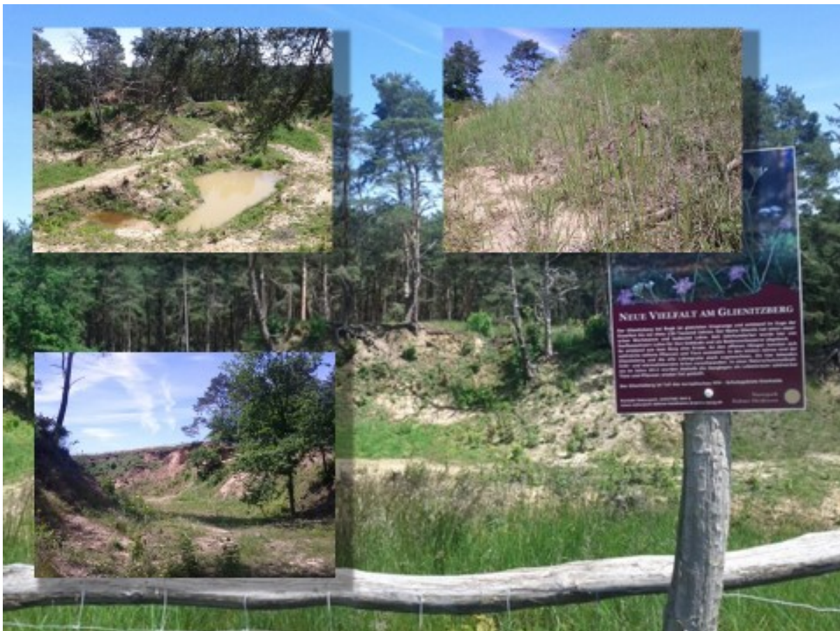
Abb. 1: Eindrücke vom Glienitzberg

Die Beweidung läuft seit dem Sommer 2013, die bisherigen Ergebnisse wurden von verschiedenen Experten einhellig als gut beurteilt.