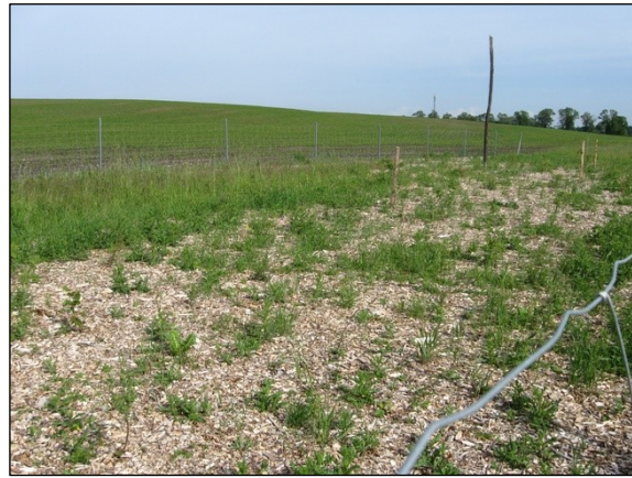
Erneuerter Stauer zur erhöhten Wasserhaltung Pflanzfläche direkt nach Anlage

Die Ersteinrichtung des Pools durch Pflanzungen und Wasserbau wurde im Winter 2011/2012 und im Frühjahr 2012 durchgeführt. 2013 wurde mit der UNB ein Konzept für die abschnittsweise Pflege der Wiesenbereiche abgestimmt und seitdem durchgeführt.