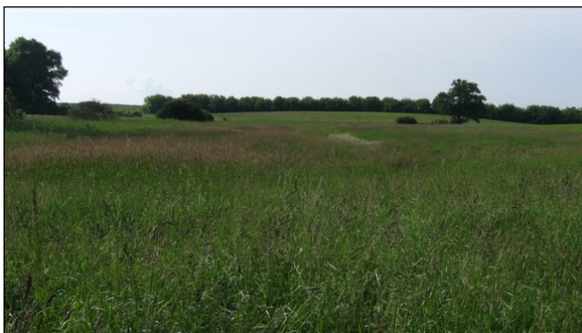
Blick in den Wiesenbereich

2016 wurde die Pflegenutzung auf Schafbeweidung umgestellt.