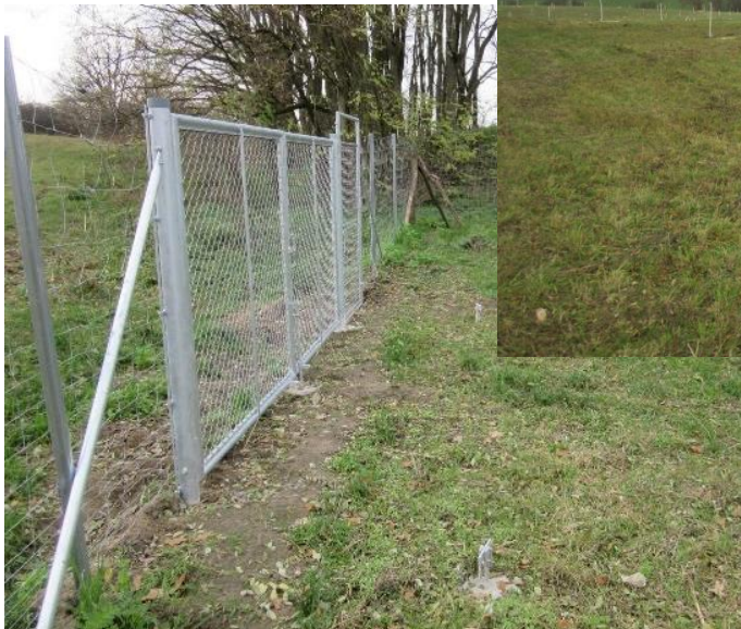
Drei Tore mit Wirtschaftseinfahrt und unverschlossenem seitlichem Besucherdurchgang

Weiterführende Informationen können Sie bei Bedarf unter unten angegebener Adresse erhalten.