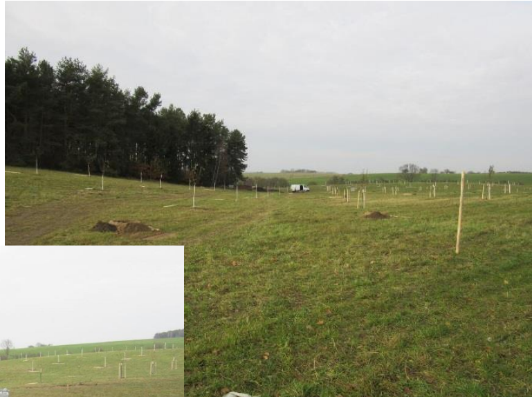
Blick nach Nordwest