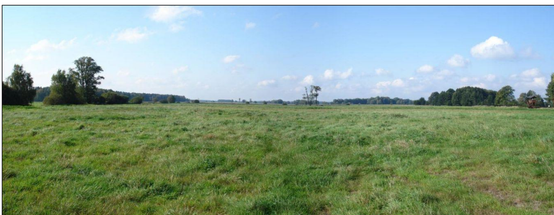
Abb. 2: Panorama der Grenzelwiesen vor Umsetzung der Pool-Maßnahmen: Großes Lebensraumpotenzial, aber wenig Lebensraumqualität und -vielfalt auf dem großflächigen Intensivgrünland

Die Grenzelwiesen sind ein bedeutender, aber vor der Realisierung der Pool-Maßnahmen stark degradiertes Niedermoorstandort. Durch die Maßnahmen des Flächenpools wird dieser wieder vernässt und so der Abbauprozess des Moores gestoppt und neues Torfwachstum initiiert. Dies wird v.a. durch den teilweisen Verschluss eines heutigen Hauptentwässerungsgrabens erreicht, wodurch das Wasser in die Fläche ausgelenkt wird. Es soll sich dort ein abgestufte Folge von dauerhaft und temporär vernässten Standorten ausbilden.