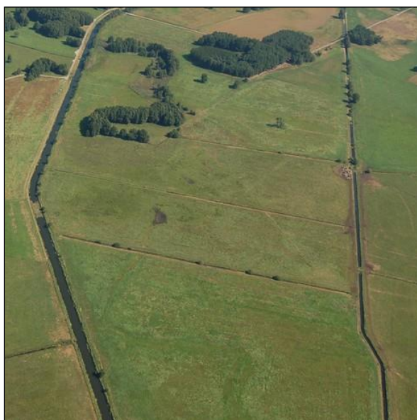
Abb. 1: Luftbild-Übersicht über die Poolfläche zwischen Nieplitz und Entwässerungsgraben

Die Grenzelwiesen sind ein bedeutender, aber vor der Realisierung der Pool-Maßnahmen stark degradiertes Niedermoorstandort. Durch die Maßnahmen des Flächenpools wird dieser wieder vernässt und so der Abbauprozess des Moores gestoppt und neues Torfwachstum initiiert. Dies wird v.a. durch den teilweisen Verschluss eines heutigen Hauptentwässerungsgrabens erreicht, wodurch das Wasser in die Fläche ausgelenkt wird. Es soll sich dort ein abgestufte Folge von dauerhaft und temporär vernässten Standorten ausbilden.