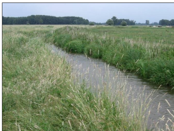
Abb. 4: Die Auslenkung am Bockwurstgraben – von hier läuft das Wasser in die Fläche

Alle Bau- und Pflanzarbeiten wurden zwischen September 2010 und April 2011 durchgeführt. Einige Bilder zu den ersten Eindrücken nach der Durchführung der Maßnahmen: