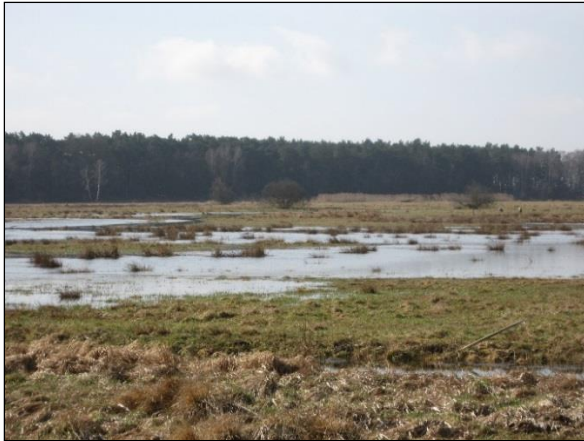
Abb. 6: Bereits im März 2011 zeigen sich direkt nach Beginn der Vernässung die Auswirkungen in der Fläche