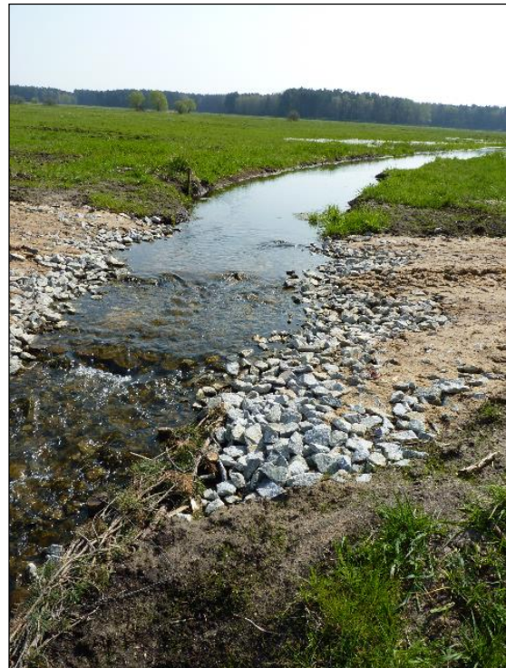
Abb. 7: Die Sohlschwelle, durch die der Wasserstand geregelt wird und die gleichzeitig als Furt für den Landwirt und die Pflege der Pflanzung dient.

In den Jahren 2012 bis 2015 erfolgte die den neuen Wasserstandverhältnissen angepasste Pflegenutzung sowie die Entwicklungspflege der Gehölzpflanzungen. Im Frühjahr 2014 wurde erstmals in den stärker vernässten Bereichen eine Mahd mit Beräumung durchgeführt, um beginnende Gehölzsukzession zurückdrängen.