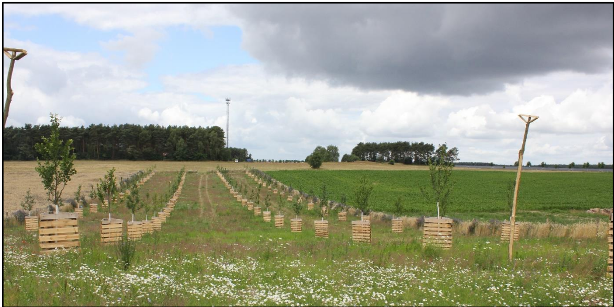
Streuobstwiese Bochow (Juli 2014)

Weiterführende Informationen können Sie bei Bedarf unter unten angegebener Adresse erhalten.