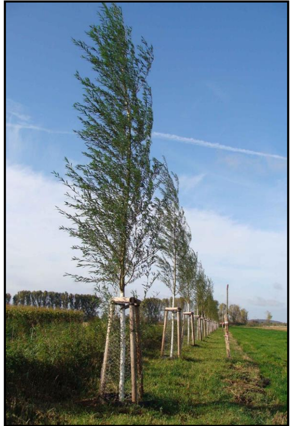
Pflanzung westlich Schmergow (Oktober 2011)

Die gesamten Pflanzmaßnahmen sind in 2014 durch die Anlage einer Streuobstwiese auf ca. 1 ha westlich der Ortslage Bochow ergänzt worden. Diese Maßnahme ist bereits durch die Untere Naturschutzbehörde anerkannt worden und wird nach Ablauf der gültigen Pachtverträge und in enger Kooperation mit der Dorfgemeinschaft und der Kommune auf insgesamt ca. 5 ha erweitert. Die dauerhafte Pflege ist durch Schafbeweidung gewährleistet. Hierzu wurde eine Kooperation zwischen einem Schäferbetrieb aus Berge/Nauen und dem Besitzer der Flächen in Bochow beschlossen.