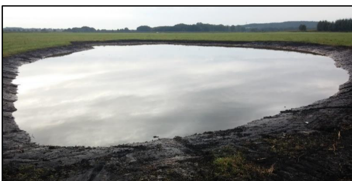
Abb. 4

Im Herbst 2015 sind dann drei Senken und zusätzliche Pflanzflächen eingerichtet worden