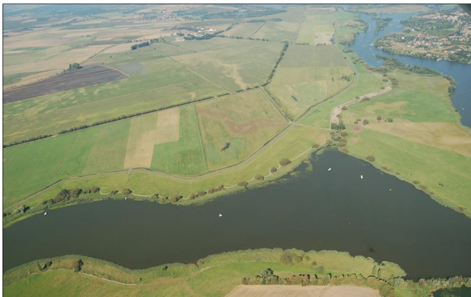
Abb. 2: Luftbild Pool Schmergow, 2. Bauabschnitt