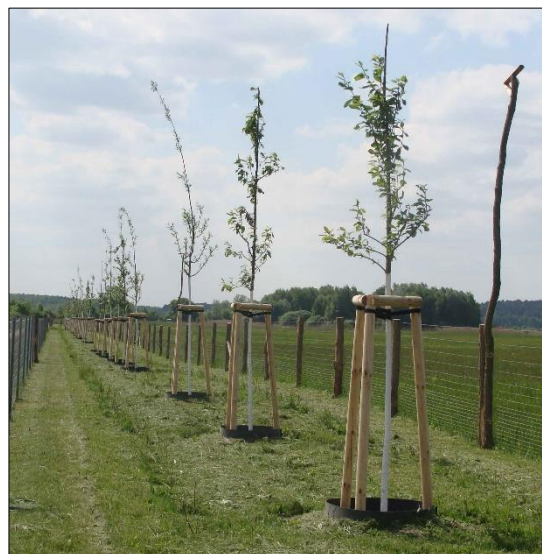
Abb. 3

In allen Senken konnten 2017 rufende Rotbauchunken nachgewiesen werden.