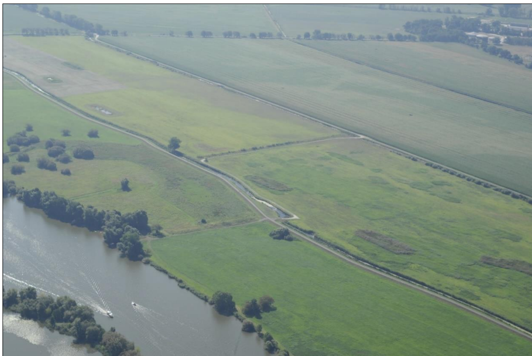
Abb. 1: Luftbild Pool Schmergow, 1. Bauabschnitt

Auf den Flächen erfolgt eine extensive Grünlandnutzung. Gleichzeitig haben die Gebiete durch die Anlage von Senken sowie durch Pflanzmaßnahmen entlang der Wege und Gräben eine größere Strukturvielfalt erhalten.